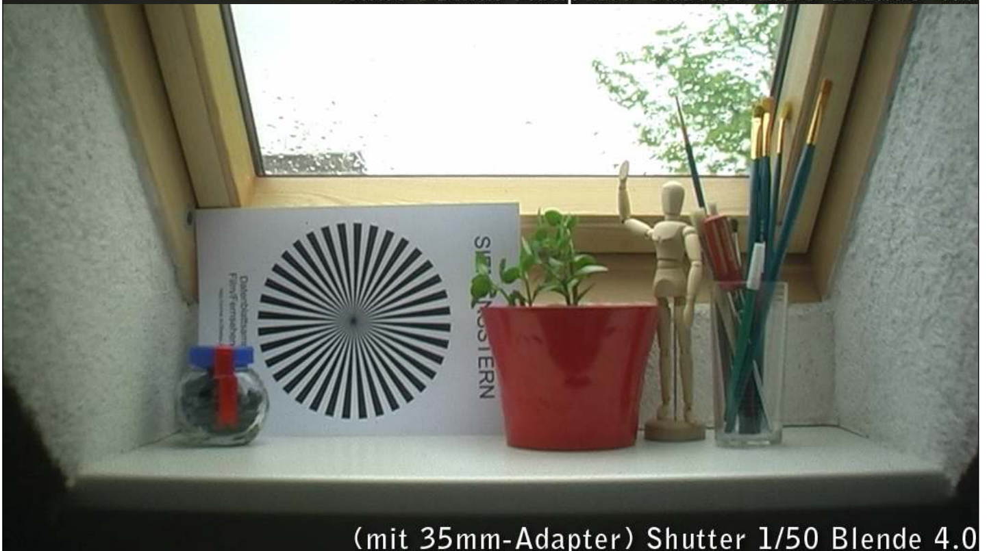
(mit 35mm-Adapter) Shutter 1/50 Blende 4.0