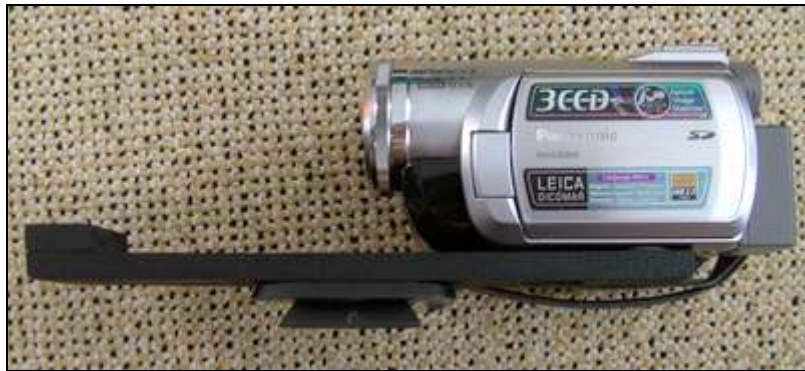
Mehr Bilder siehe ganz oben!

Aus einer Holzlatte (Baumarkt), Klettband und einer Stativschraube (Habe ich von Andreas, dem Techniker im OK-Salzwedel bekommen. Vielen Dank!) habe ich mir noch eine Halterung gebastelt. Weil der Adapter relativ lang und schwer ist und ich das Kameragewinde nicht so sehr belasten möchte, macht sich das ganz gut.