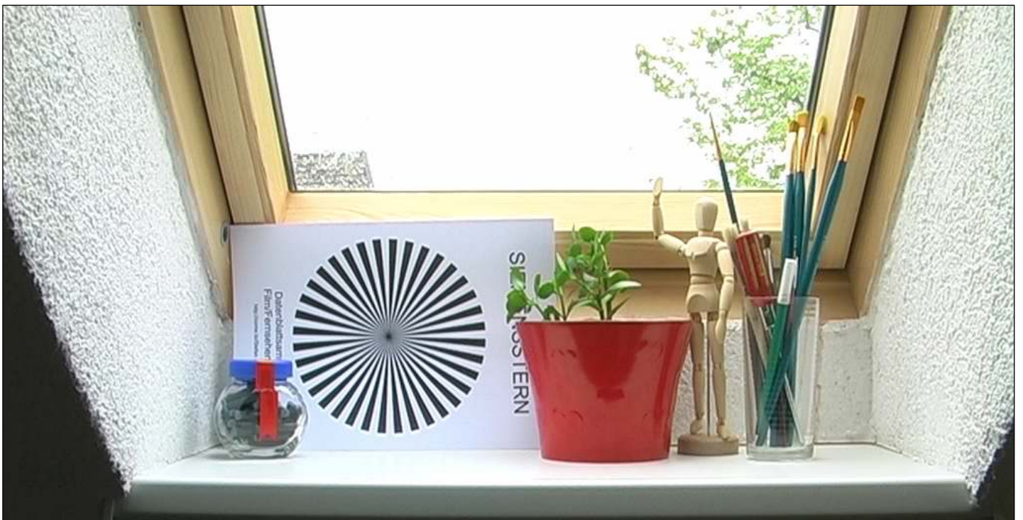
(ohne 35mm-Adapter) Shutter 1/50 Blende 4.0