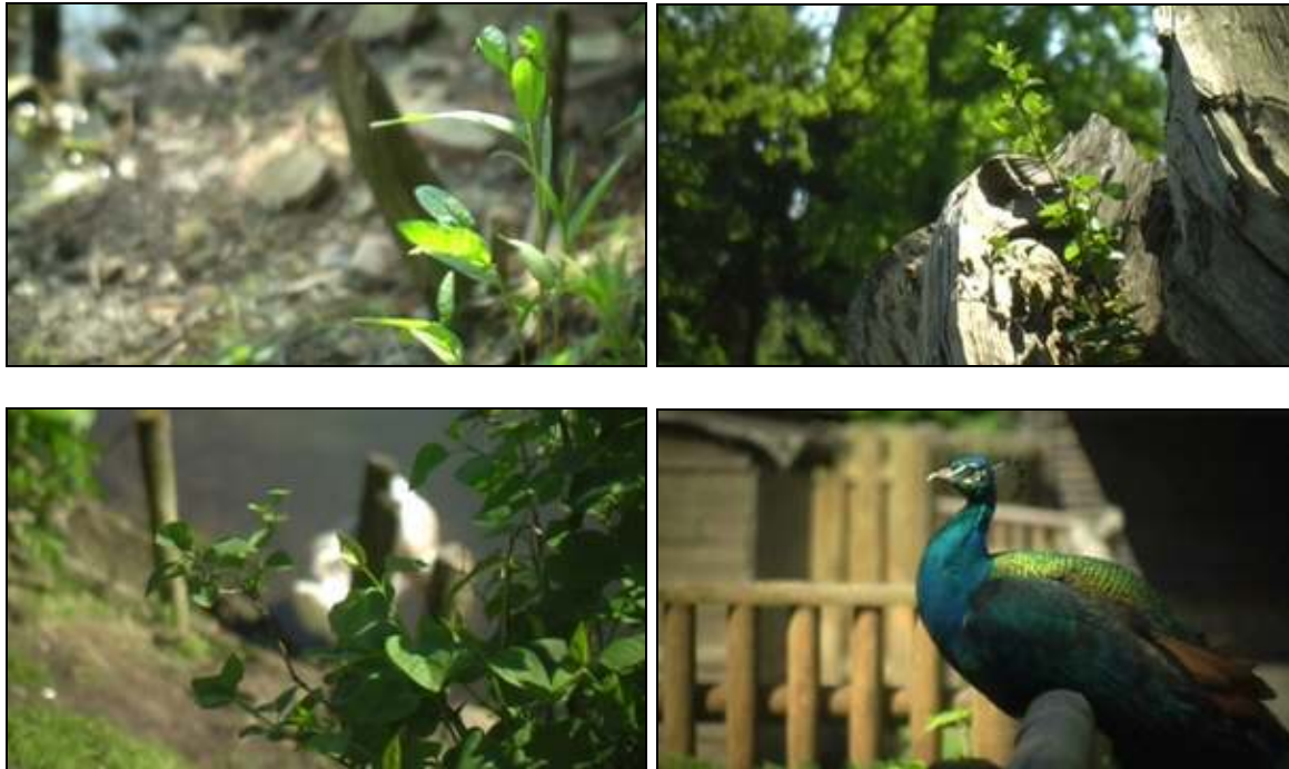
Dies sind Testaufnahmen ohne Farbkorrektur!

Der 35mm-Adapter mit statischer Mattscheibe / Kamera: Panasonic NV-GS300; MiniDV; SD; 3CCD